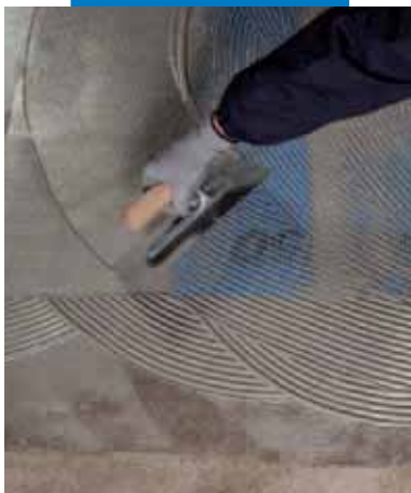
Укладка Mapenet 150 поверх первого свежего слоя Mapelastic Turbo