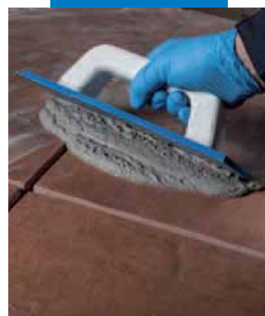
Заполнение швов с помощью Ultracolor Plus

Значения адгезии согласно EN 14891 измеренные с применением Mapelastic Turbo и цементного клея типа C2 согласно EN 12004