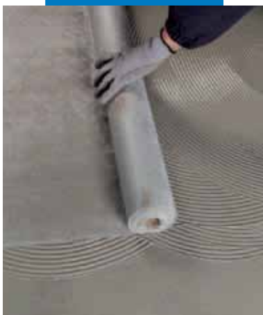
Укладка Mapetex Sel поверх первого свежего слоя Mapelastic Turbo