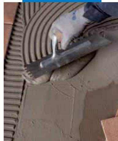
Приклеивание плитки с помощью Elastorapid