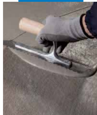
Нанесение второго слоя Mapelastic Turbo поверх первого, армированного Mapetex Sel