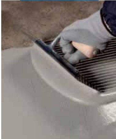
Нанесение первого слоя Mapelastic Turbo

- для заполнения деформационных швов используйте специальный эластичный герметик МАПЕИ (например, Mapeflex PU 45 , Mapesil AC или Mapesil LM ). Другие типы